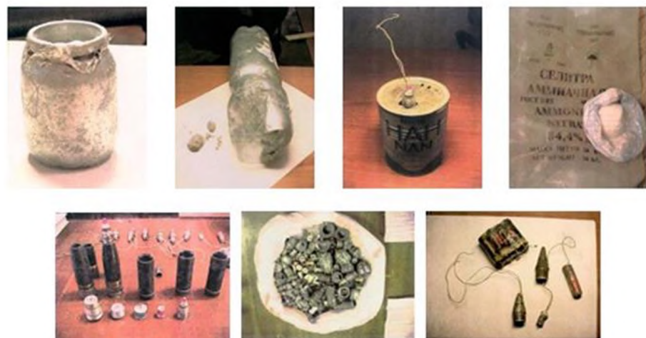
Фотографии взрывных устройств и их компонентов, изготовленных из штатных боеприпасов, аммиачной селитры и алюминиевой пудры, изъятых в процессе оперативно-розыскных мероприятий оперработниками ФСБ России

ПОМНИТЕ: внешний вид предмета может скрывать его настоящее назначение. В качестве камуфляжа для взрывных устройств используются обычные бытовые предметы: сумки, пакеты, свертки, коробки, игрушки и т.п.